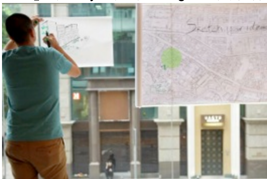
06: 參加者在「非常香港畫一夜」中盡情發揮創意，以「繪畫」提升香港的城市空間質素。