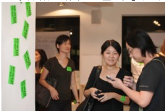
07: 公眾、傳媒、本地藝術家及「非常香港」合作伙伴雲集上環創意畫廊 The Space Gallery，參與「非常香港畫一夜」