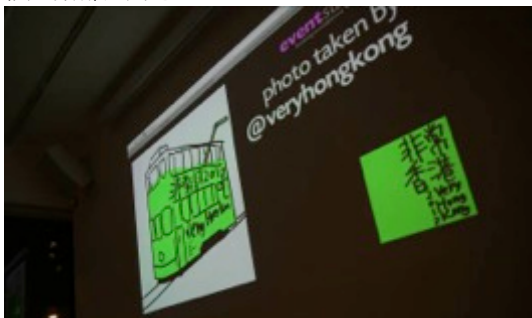
05: 在「非常香港畫一夜」中，主辦單位鼓勵參加者即場將他們的無限創意上載至「非常香港」(#veryhk)的 Instagram 官方專頁。